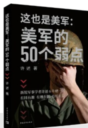
许述著 中国青年出版社 2024年5月出版

俄国十月革命胜利后，马克思主义的科学性、批判性和斗争性得到了充分展现，部分留日生开始将马克思主义与中国实际问题联系起来，开始探索以其指导中国社会革命实践的可能性。在他们的努力下，中国对马克思主义的研究和宣传被推向了更加深入的层面。