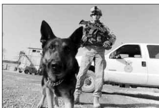
阿富汗战场随处可见的嗅弹犬

珍珠港事件后几十年美苏争霸中，强大如苏联也没敢对美国本土发动袭击。苏联解体后，美国觉得自己天下无敌，可以高枕无忧，不料被几架飞机炸醒了迷梦。“9·11”事件让美