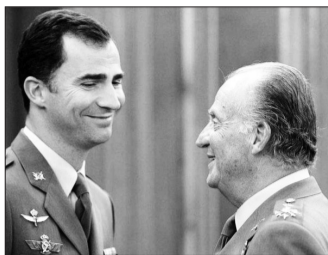
▲2005年,胡安·卡洛斯一世与还是王储的费利佩交谈

佩六世想要的。虽然一出生就注定会成为国王,可真正担起父亲留下的“烂摊子”,将民众对王室的骂声转变为赞誉,费利佩六世这些年并不轻松。