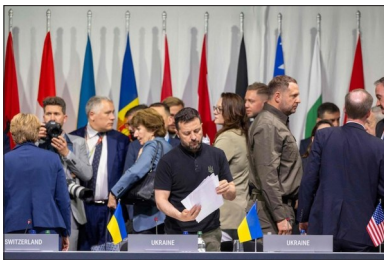
2024年6月,乌克兰和平峰会现场

另一边,对于美俄关系的缓和将为俄乌局势的缓解注入多少“正能量”,兰州大学政治与国际关系学院副教授韦